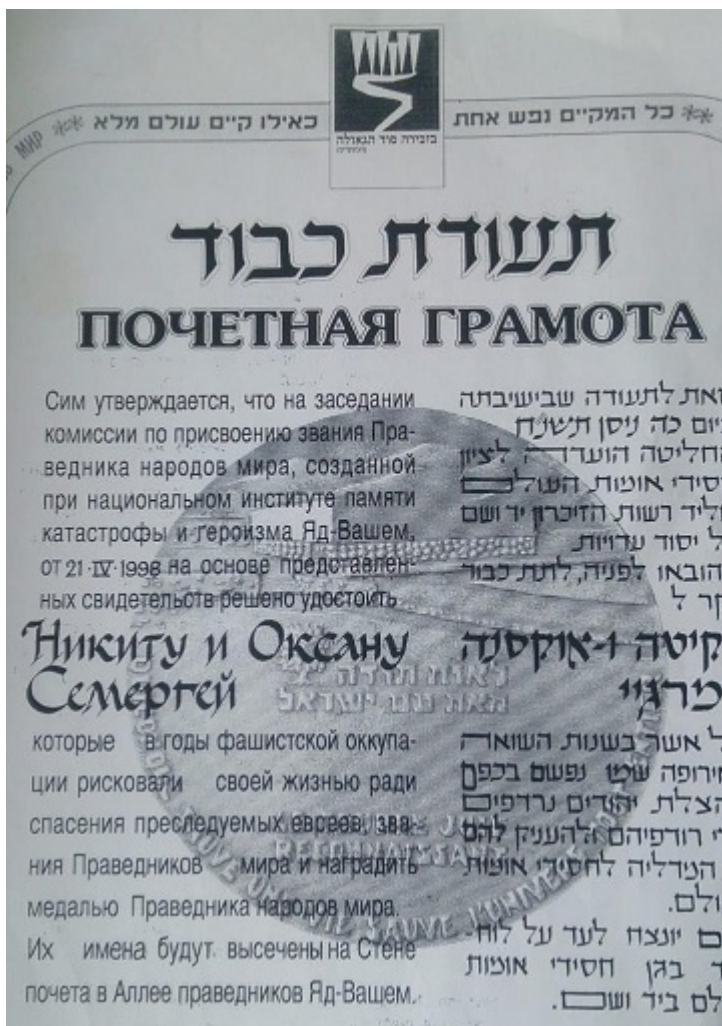
Диплом Праведників народів світу